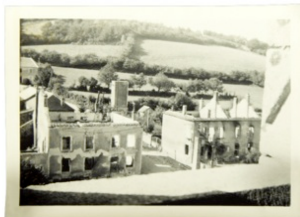
Incendie de maisons à Dun-les-Places

Au matin du 28 juin, certaines maisons choisies sont incendiées. Vers 12h30, les soldats quittent le village au son de l'accordéon, laissant derrière eux un village complètement pillé, en partie brûlé et surtout 27 fusillés.