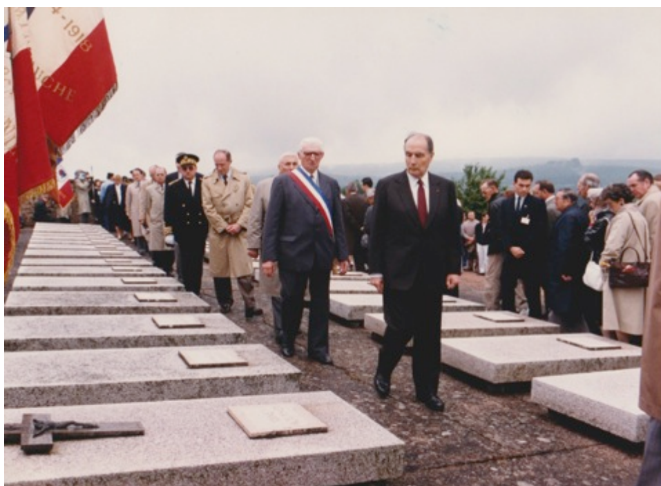
Cérémonie à Dun-les-Places en présence de F. Mitterrand

Les célébrations du 26 juin ont toujours été des moments importants du souvenir. Très tôt, François Mitterrand, député de la Nièvre participe à cette cérémonie (dès 1948). Le 26 juin 1981, récemment élu président de la République, il se rend à Dun-les-Places pour sa première sortie officielle en province. L'histoire de Dun-les-Places entre dans la mémoire nationale.