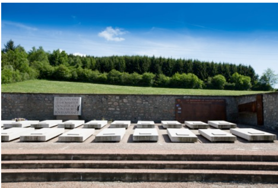
Cimetière de Dun-les-Places

Dun-les-Places se trouve dans une zone importante de maquis épaulés par des parachutistes anglais, des SAS. Le village a fait l'objet de dénonciations et d'espionnages. Cette répression est une opération violente contre une population patriote surveillée. Deux conférences, organisées à Dijon, ont préparé cette attaque. De nombreuses troupes allemandes de la Wehrmacht, ainsi que des Russes (Armée de Vlassov) et des miliciens participent à cette opération. La coordination régionale et la venue de troupes de plusieurs départements soulignent la préparation méticuleuse et «soignée».